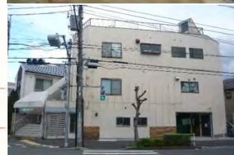
リタリコ発達ナビ ホームページ